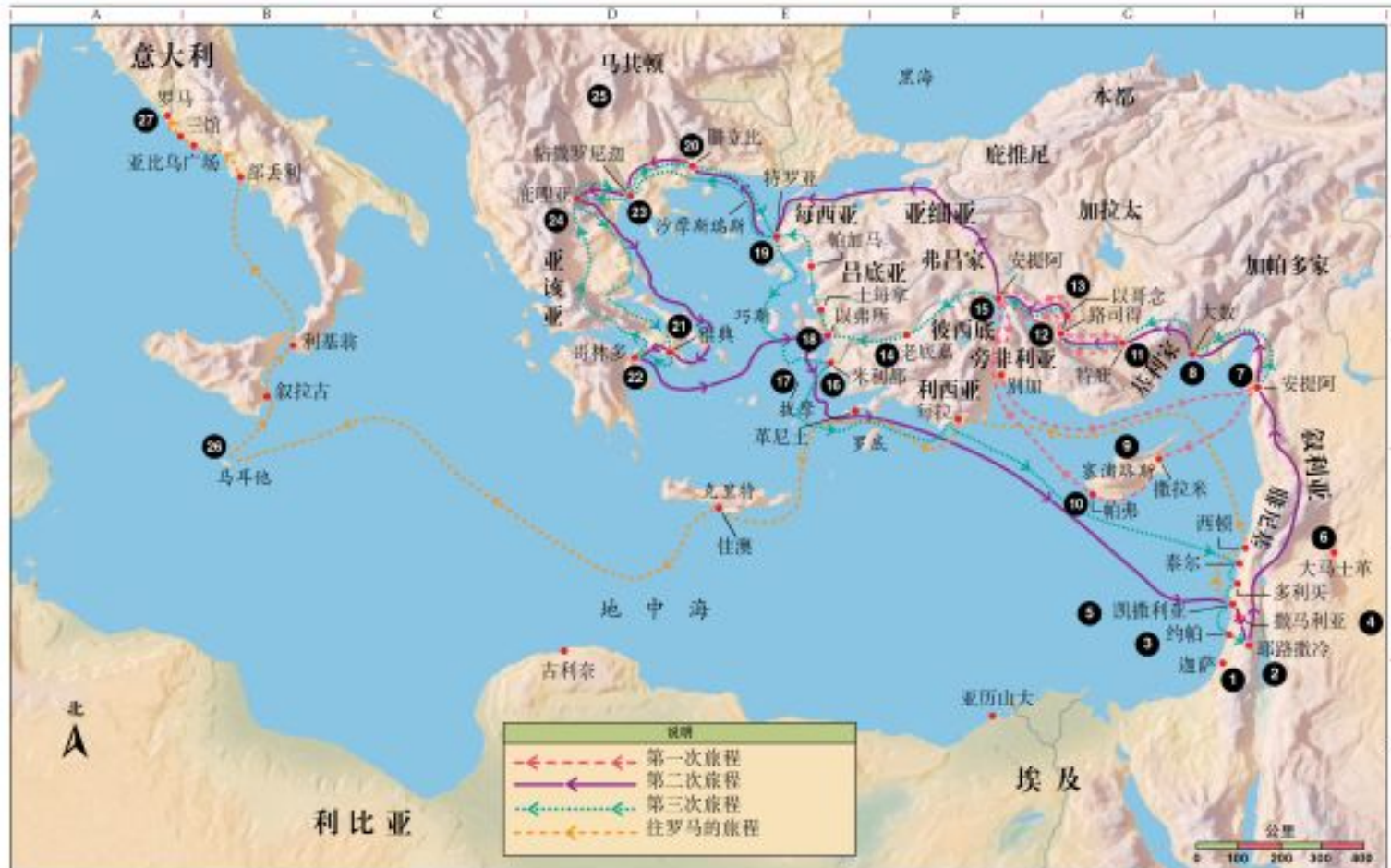
13. 使徒保罗的传道旅程